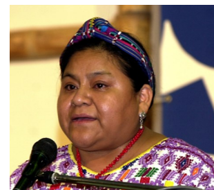
Rigoberta Menchú, Premio Nobel de la paz 1992.

“La salida al mar de Bolivia es parte de la paz regional, pero sobre todo, es parte de la unidad de los pueblos de América Latina. El objetivo de mi presencia en las audiencias de la CIJ (2015) se debe a que los guatemaltecos dejemos un testimonio vivo que estamos presentes en la solución, o en la demanda del diálogo, una negociación y sobre todo una salida perdurable”.