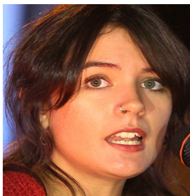
Camila Vallejo, diputada chilena.

“Creo que es lamentable el punto al cual hemos tenido que llegar, pero sí estoy de acuerdo con una salida soberana al mar para Bolivia en el marco de una política de integración”.