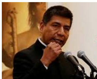
Fernando Huanacuni, Canciller del E. P. de Bolivia.

“Bolivia reitera que esta comparecencia ante la Corte Internacional de Justicia no es un acto hostil frente al gobierno y menos frente al pueblo de Chile. Al contrario, ambos Estados hacemos uso del espacio previsto por el Derecho Internacional para resolver nuestras diferencias en paz”.